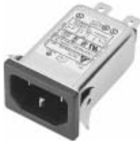
NG3QM(H) (Optional wire type)