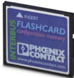
Program and configuration memory, plug-in, 256 MB

Please be informed that the data shown in this PDF Document is generated from our Online Catalog. Please find the complete data in the user's documentation. Our General Terms of Use for Downloads are valid ( http://download.phoenixcontact.com )