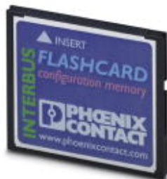
Program and configuration memory, plug-in, 256 MB

Please be informed that the data shown in this PDF Document is generated from our Online Catalog. Please find the complete data in the user's documentation. Our General Terms of Use for Downloads are valid ( http://download.phoenixcontact.com )