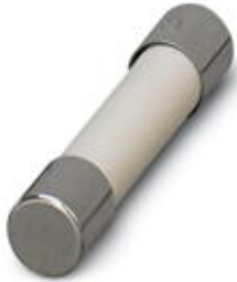
Output fuse (5x20 mm) acc. to IEC 127-2/EN 60127-2, 2 A fast blow

Please be informed that the data shown in this PDF Document is generated from our Online Catalog. Please find the complete data in the user's documentation. Our General Terms of Use for Downloads are valid ( http://phoenixcontact.com/download )