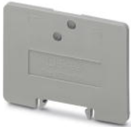
Partition plate, Length: 42.5 mm, Width: 2.5 mm, Height: 30.5 mm, Color: gray

Please be informed that the data shown in this PDF Document is generated from our Online Catalog. Please find the complete data in the user's documentation. Our General Terms of Use for Downloads are valid ( http://phoenixcontact.com/download )