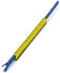
Conductor marking collar, Labeled with the number: 4, yellow, Width: 3.2 mm

Please be informed that the data shown in this PDF Document is generated from our Online Catalog. Please find the complete data in the user's documentation. Our General Terms of Use for Downloads are valid ( http://phoenixcontact.com/download )