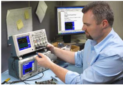
Easily store and transfer waveforms and measurement data to USB.