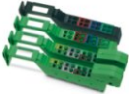
Connector set for Inline bus coupler, color-coded

Please be informed that the data shown in this PDF Document is generated from our Online Catalog. Please find the complete data in the user's documentation. Our General Terms of Use for Downloads are valid ( http://phoenixcontact.com/download )