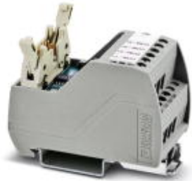
VARIOfACE Professional (VIP) board for the ROC800 controller

Please be informed that the data shown in this PDF Document is generated from our Online Catalog. Please find the complete data in the user's documentation. Our General Terms of Use for Downloads are valid ( http://phoenixcontact.com/download )