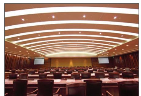
LED panel-lighting applications