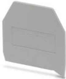
End cover, Length: 43 mm, Width: 1.5 mm, Color: gray

Please be informed that the data shown in this PDF Document is generated from our Online Catalog. Please find the complete data in the user's documentation. Our General Terms of Use for Downloads are valid ( http://phoenixcontact.com/download )