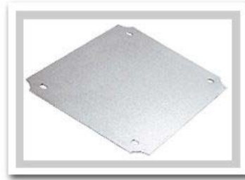
Click on Image for Larger View

Aluminum Internal Panels for AN series boxes. Used to mount customer equipment inside the enclosures. Assembles to mounting bosses on inside of enclosure.