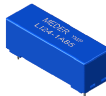
Marking according to EN60062/factory code gem. EN60062/Fertigungsstätte