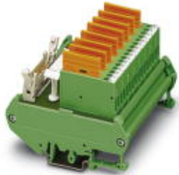
Fuse module with LEDs (for digital input cards of the Delta V control system)

Please be informed that the data shown in this PDF Document is generated from our Online Catalog. Please find the complete data in the user's documentation. Our General Terms of Use for Downloads are valid ( http://phoenixcontact.com/download )