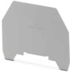
Separating plate, Length: 61 mm, Width: 0.8 mm, Color: gray

Please be informed that the data shown in this PDF Document is generated from our Online Catalog. Please find the complete data in the user's documentation. Our General Terms of Use for Downloads are valid ( http://download.phoenixcontact.com )