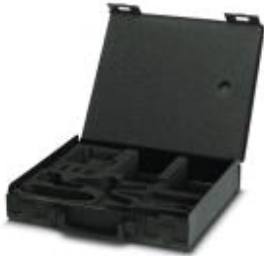
Replacement case, empty

Please be informed that the data shown in this PDF Document is generated from our Online Catalog. Please find the complete data in the user's documentation. Our General Terms of Use for Downloads are valid ( http://phoenixcontact.com/download )