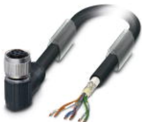
Bus system cable, 6-position, PVC, black, shielded, free cable end, on Socket angled M12 SPEEDCON, A-coded, cable length: 3.5 m, Customer version

Please be informed that the data shown in this PDF Document is generated from our Online Catalog. Please find the complete data in the user's documentation. Our General Terms of Use for Downloads are valid ( http://phoenixcontact.com/download )