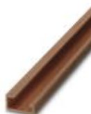
G-profile DIN rail, deep-drawn, material: Copper, unperforated, height 15 mm, width 32 mm, length 2 m

DIN rail - NS 32 CU/120QMM UNPERF 2000MM - 1201280