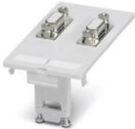
Front plate with contact inserts, plastic with shroud, 2 x 9-pos. D-SUB (solder connection/socket)

Please be informed that the data shown in this PDF Document is generated from our Online Catalog. Please find the complete data in the user's documentation. Our General Terms of Use for Downloads are valid ( http://phoenixcontact.com/download )