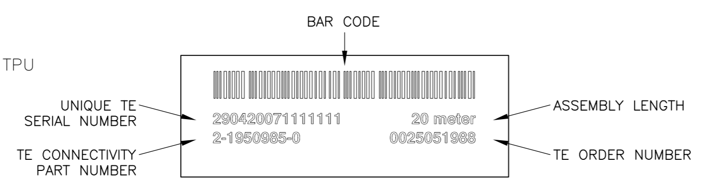
LABEL DETAIL: 3