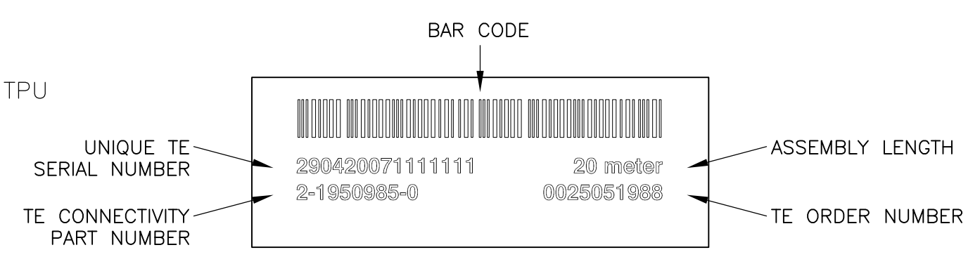
LABEL DETAIL: 3