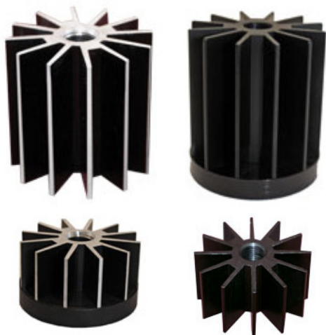
60 mm Diameter & 100 mm Diameter Heat Sinks