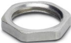
Flat nut with M16 thread

Please be informed that the data shown in this PDF Document is generated from our Online Catalog. Please find the complete data in the user's documentation. Our General Terms of Use for Downloads are valid ( http://download.phoenixcontact.com )