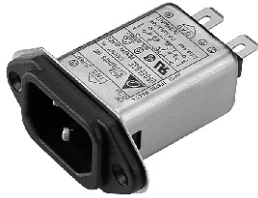
EG3E, EG3Q (Optional soldering lug or wire type)