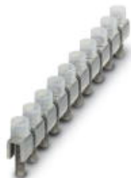
Fixed bridge, Number of positions: 10, Color: silver

Please be informed that the data shown in this PDF Document is generated from our Online Catalog. Please find the complete data in the user's documentation. Our General Terms of Use for Downloads are valid ( http://download.phoenixcontact.com )