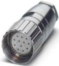
Cable connector, straight, shielded: no, Screw locking, M23, cable diameter range: 8 mm ... 12 mm

Please be informed that the data shown in this PDF Document is generated from our Online Catalog. Please find the complete data in the user's documentation. Our General Terms of Use for Downloads are valid ( http://phoenixcontact.com/download )