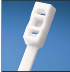
PLB4H Head Design