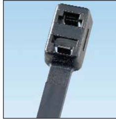
PLB2S/3S/4S Head Design