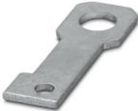
Plate for fixing the FLT-ISG-100-EX isolating spark gap to a flange, drill hole diameter of 22 mm.

Please be informed that the data shown in this PDF Document is generated from our Online Catalog. Please find the complete data in the user's documentation. Our General Terms of Use for Downloads are valid ( http://phoenixcontact.com/download )