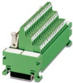
VARIOFACE module, with screw connection and flat-ribbon cable connector, for assembly on NS 35/7.5, 64 positions

Please be informed that the data shown in this PDF Document is generated from our Online Catalog. Please find the complete data in the user's documentation. Our General Terms of Use for Downloads are valid ( http://phoenixcontact.com/download )