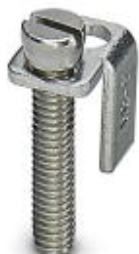
Switching jumper, Number of positions: 2, Color: silver

Please be informed that the data shown in this PDF Document is generated from our Online Catalog. Please find the complete data in the user's documentation. Our General Terms of Use for Downloads are valid ( http://phoenixcontact.com/download )