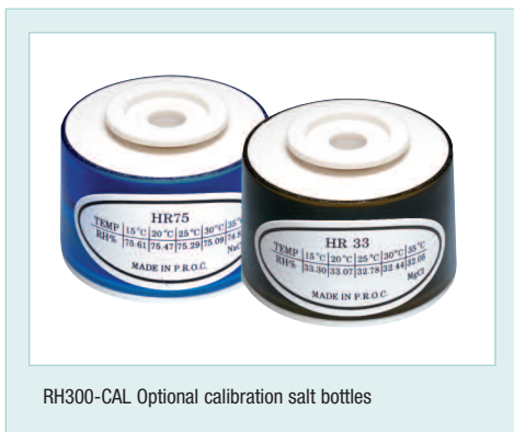
RH300-CAL Optional calibration salt bottles