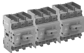
CDNF30 CDF60 CDF100