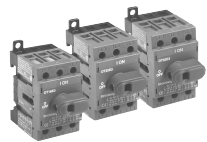
CDNF16 CDF25 CDF32