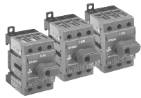
CDNF16 CDF25 CDF32