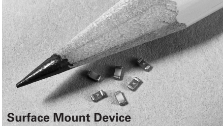
Surface Mount Device