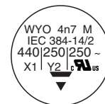
WYO 3.3 nF to 12 nF

All approval marks are also shown on the label.