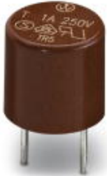
Replacement fuse, for INTERBUS-ST modules

Please be informed that the data shown in this PDF Document is generated from our Online Catalog. Please find the complete data in the user's documentation. Our General Terms of Use for Downloads are valid ( http://phoenixcontact.com/download )