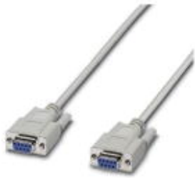
RS-232 cable, 9-pos. D-SUB female connector on 9-pos. D-SUB female connector, 9-wire, 1:1

Please be informed that the data shown in this PDF Document is generated from our Online Catalog. Please find the complete data in the user's documentation. Our General Terms of Use for Downloads are valid ( http://download.phoenixcontact.com )