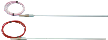
Thermocouples can be found in Accessories