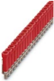
Jumper, Number of positions: 100, Color: red

Please be informed that the data shown in this PDF Document is generated from our Online Catalog. Please find the complete data in the user's documentation. Our General Terms of Use for Downloads are valid ( http://download.phoenixcontact.com )