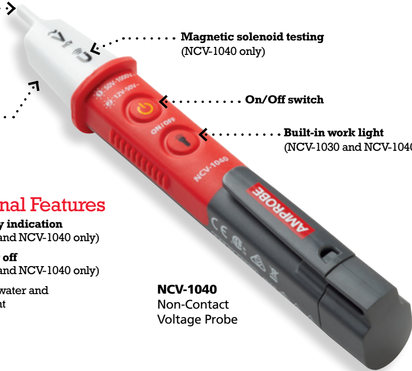
NCV-1040 Non-Contact Voltage Probe