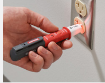
Test wall sockets for AC voltage