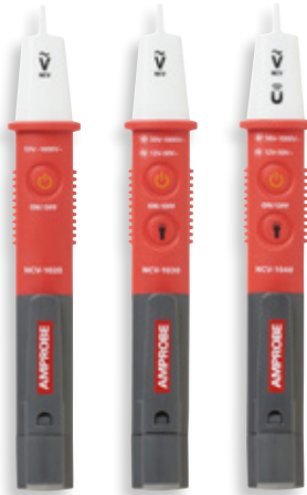
NCV-1000 Series Non-Contact Voltage Probe

The Amprobe NCV-1000 Non-Contact Voltage (NCV) tester series provides maximum safety and convenience for detecting AC voltage without interrupting electrical systems. Designed to conveniently fit in your shirt pocket, the NCV-1000 series performs in indoor and outdoor settings. Safety tested to the highest category measurement, CAT IV 1000 V, as well as IP65 water and dust resistant, the NCV-1000 series is fit for the toughest industrial applications.