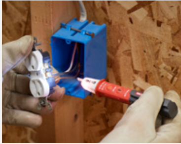
Test wires for AC voltage