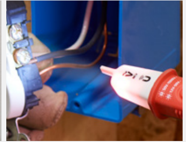
Built-in worklight (NCV-1030, NCV-1040)