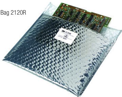
3M™ Cushioned Shielding Bag 2120R

The Cushion Shielding Bag 2120R protects devices from physical damage as well as provides static shielding. They also offer a heat sealable inner surface.