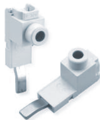
Type/Cat. No: P50UT Description: Power Feed Lug