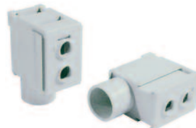
Type/Cat. No: P50UB Description: Modular Direct Power Feed