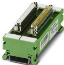
VARIOFACE termination board, with a 37-pos. D-SUB socket strip to a 37-pos. D-SUB pin strip, 1:1 connection

Please be informed that the data shown in this PDF Document is generated from our Online Catalog. Please find the complete data in the user's documentation. Our General Terms of Use for Downloads are valid ( http://phoenixcontact.com/download )