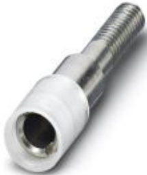
Female test connector, Color: transparent

Please be informed that the data shown in this PDF Document is generated from our Online Catalog. Please find the complete data in the user's documentation. Our General Terms of Use for Downloads are valid ( http://phoenixcontact.com/download )