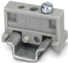
End clamp, width: 6.2 mm, color: gray

Please be informed that the data shown in this PDF Document is generated from our Online Catalog. Please find the complete data in the user's documentation. Our General Terms of Use for Downloads are valid ( http://download.phoenixcontact.com )