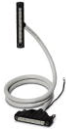
Assembled round cable with two molded 50-pos. socket strips (1:1 connection). Cable length: 7.0 m

Please be informed that the data shown in this PDF Document is generated from our Online Catalog. Please find the complete data in the user's documentation. Our General Terms of Use for Downloads are valid ( http://phoenixcontact.com/download )