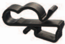
SunRunner 2 UVX