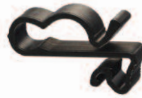
SunRunner 2-U UVX