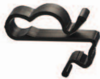
SunRunner 2-R UVX