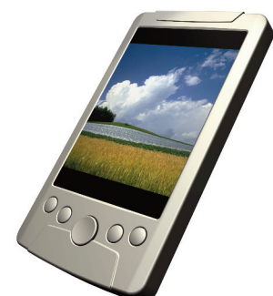
Compact consumer applications