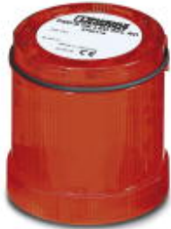
LED random flashing beacon element, 24 V DC, red

Please be informed that the data shown in this PDF Document is generated from our Online Catalog. Please find the complete data in the user's documentation. Our General Terms of Use for Downloads are valid ( http://phoenixcontact.com/download )