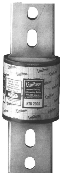
Dimensional Data *All other tolerances (±0.02)